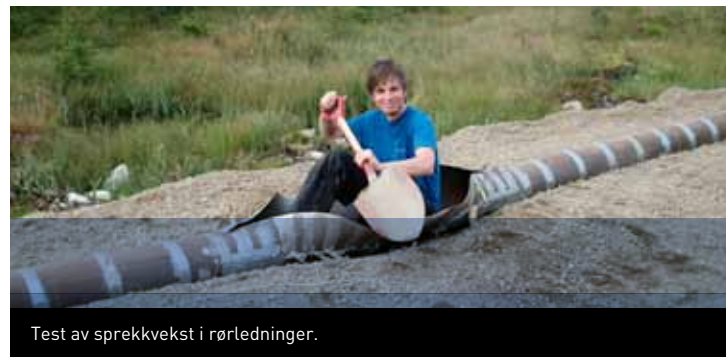
Test av sprekkvekst i rørledninger.

Gjennom våre bedriftskontakter tilrettelegger industriringen sommerjobb, prosjekt- og masteroppgaver og ansettelser. I tillegg har industriringen bidratt til muliggjøring av ekskursjon for 3. årskurs.