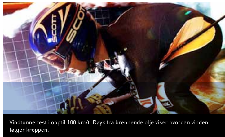
Vindtunneltest i opptil 100 km/t. Røyk fra brennende olje viser hvordan vinden følger kroppen.