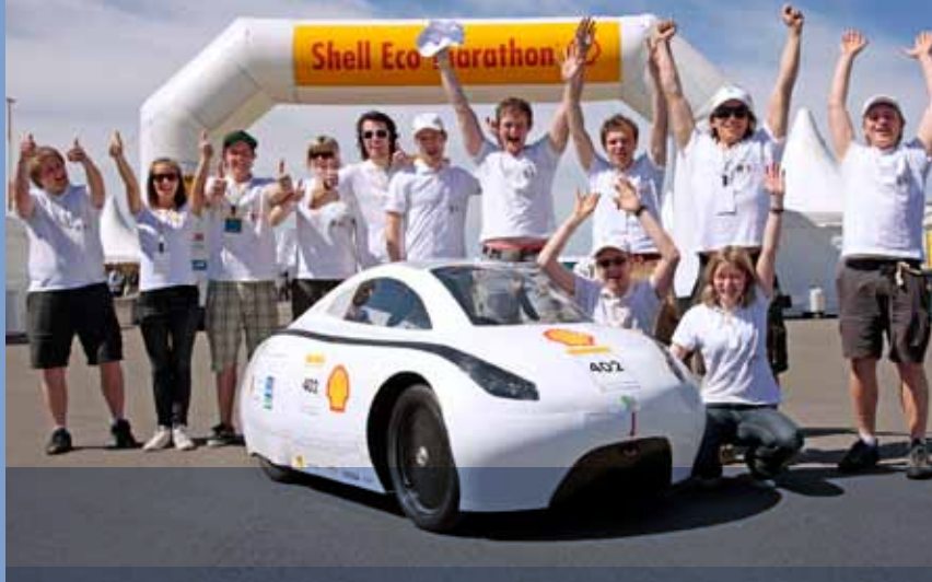
En glad gjeng etter en ny verdensrekord med utrolige 1246 km med energimengden som tilsvarer 1 liter bensin. Den gamle rekorden på 848 km er knust med 50%.