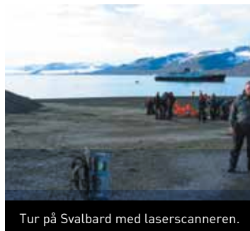
Tur på Svalbard med laserscanneren.