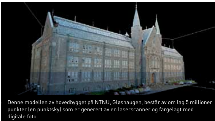
Denne modellen av hovedbygget på NTNU, Gløshaugen, består av om lag 5 millioner punkter (en punktsky) som er generert av en laserscanner og fargelagt med digitale foto.

Dessuten har visualisering blitt utrolig mye viktigere. Grensesnittet mellom konstruksjonsteknikk og IKT er et spennende felt!